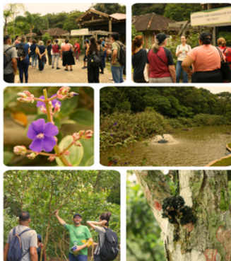
Visita Guiada ao Parque Natural Municipal do Morro da Cruz