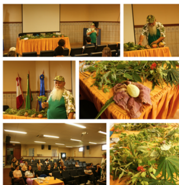
Oficina de Plantas Medicinais e PANCs