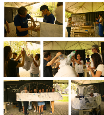
Oficina de Cultura Popular Boi de Mamão Gigante