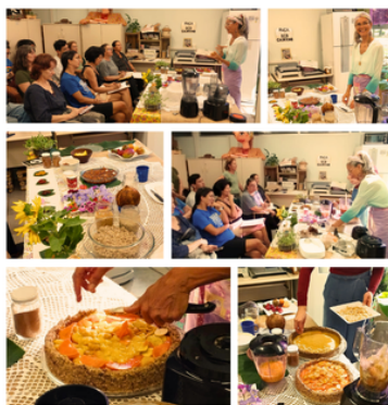
Oficina de Alimentação Viva